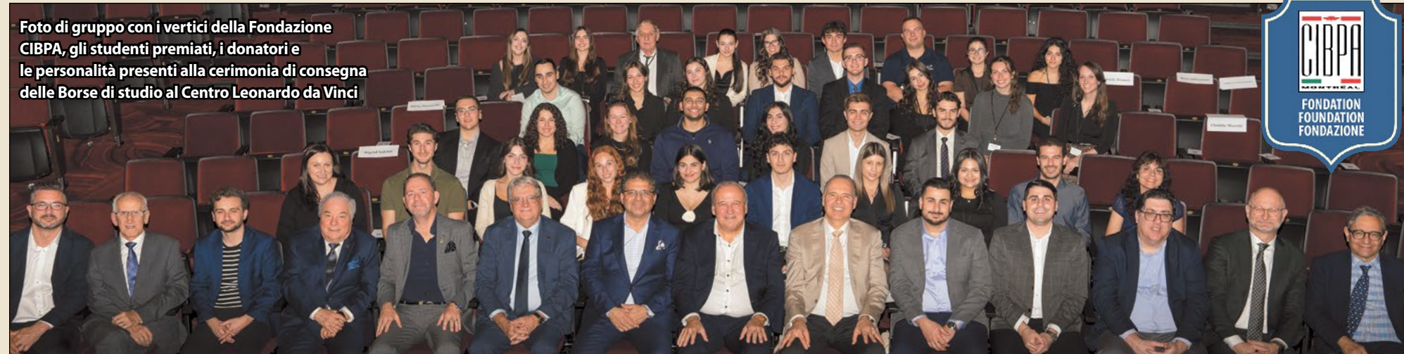
Foto di gruppo con i vertici della Fondazione CIBPA, gli studenti premiati, i donatori e le personalità presenti alla cerimonia di consegna delle Borse di studio al Centro Leonardo da Vinci