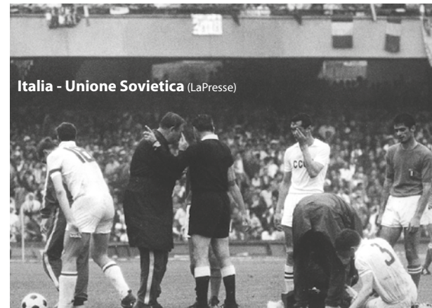
Italia - Unione Sovietica

Nazionale sfortunata, invece, nel 2000, quando, nella finale di Amsterdam, la Francia si impose grazie al Golden goal di Trezeguet nei supplementari. Nulla da fare a Polonia - Ucraina 2012, quando l'Italia dovette arrendersi alla supremazia delle furie rosse, etichettata da molti come nazionale del secolo. Come consolazione, nell'edizione 2000 Toldo vinse il premio come miglior portiere così come Gigi Buffon nel 2012.