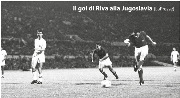
Il gol di Riva alla Jugoslavia

ROMA – La Nazionale maschile di calcio ha sempre avuto un rapporto complicato con i Campionati europei. Per cominciare, solo negli ultimi decenni ha iniziato a qualificarsi regolarmente alle fasi finali. Non partecipò, infatti, alla prima edizione del 1960 e non si qualificò nemmeno alla seconda, quattro anni dopo. Nel 1968 invece li vinse, a soli due anni di distanza dalla clamorosa eliminazione subita ai Mondiali in Inghilterra contro la sconosciuta Corea del Nord. L'unica vittoria, quindi, risale al 1968, quando le squadre alla fase finale erano ancora 4. In quell'occasione l'Italia ospitò le finali e vinse il trofeo. Ma, nonostante la presenza in squadra