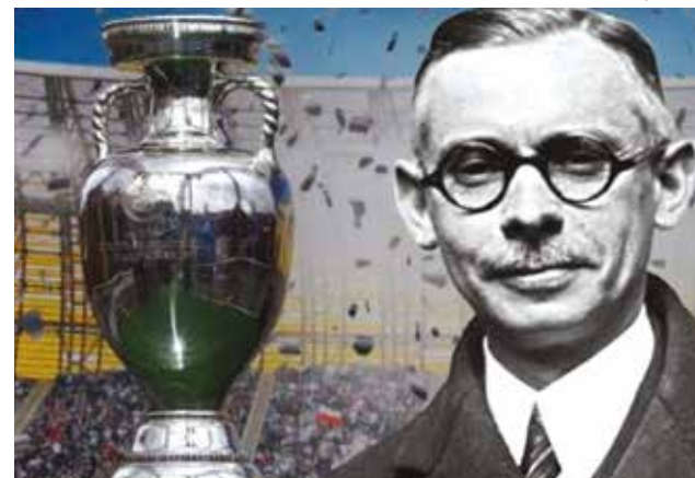
Henry Delaunay e la Coppa a lui intitolata EURO 1960: U.R.S.S.

neo di qualificazione nei due anni precedenti alla fase finale. La Coppa Internazionale: il trofeo precursore dell'Europeo. Dal 1927 al 1960 si disputò in sei edizioni una competizione per squadre nazionali: la Coppa Internazionale, precursore del campionato europeo di calcio. Questa era riservata a cinque o (nell'ultimo torneo) sei nazionali dell'Europa centrale e meridionale. L'ultima edizione ter-