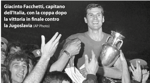
Giacinto Facchetti, capitano dell'Italia, con la coppa dopo la vittoria in finale contro la Jugoslavia

di campioni del calibro di Facchetti, Rivera, Riva, Anastasi, Mazzola e Prati, gli Azzurri allenati da Ferruccio Valcareggi fecero molta fatica. La semifinale contro l'Unione Sovietica venne vinta solo grazie al lancio della monetina dopo un deludente pareggio, mentre la finale terminò con il punteggio di 1-1 e dovette essere rigiocata dopo 2 giorni. La Nazionale riuscì infine a imporsi per 2-0, ma l'altra finalista, la Jugoslavia, dovette rinunciare a moltissimi campioni causa infortuni. Valcareggi cambiò cinque titolari e mise in campo, tra gli altri, Gigi Riva, Sandro Mazzola e Giancarlo De Sisti. Fu un'altra storia. Al quarto d'ora di gioco, Riva segnò il gol del vantaggio. Meno di mezz'ora dopo Anastasi, a cui venne anche annullato un gol, segnò il definitivo 2-0. La Jugoslavia, fisicamente provata, non riuscì più a reagire e passò 78 minuti in situazione di svantaggio. Dal gol di Anastasi i tifosi sugli spalti dell'Olimpico iniziarono ad accendere delle fiaccole,