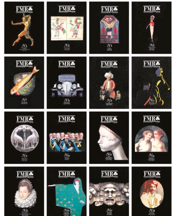
TITOLO: Copertine di alcuni numeri della rivista FMR CREATORE: Franco Maria Ricci Editore • DATA DI CREAZIONE: 1982-2003 LUOGO DI CREAZIONE: Milano, Italia • TIPO: Periodico

un grande lettore ai lettori delle generazioni successive. Borges presentava il suo canone personale, quello degli autori letti e amati in gioventù. Anche "La Biblioteca Blu", collana di repêchage uscita poco prima, coltivava lo stesso piacere per i testi, ripescando opere da un lungo periodo di oblio, così come "Morgana", anch'essa coeva, che soddisfa la curiosità estrosa per lo stravagante e l'insolito. La vividezza della raffigurazione, le immagini ingrandite e ravvicinate offrono un invito al viaggio. Franco Maria Ricci ha reinventato, in una maniera iperbolica e letterale, ciò che chiamiamo una guida. Versioni estreme del viaggio con