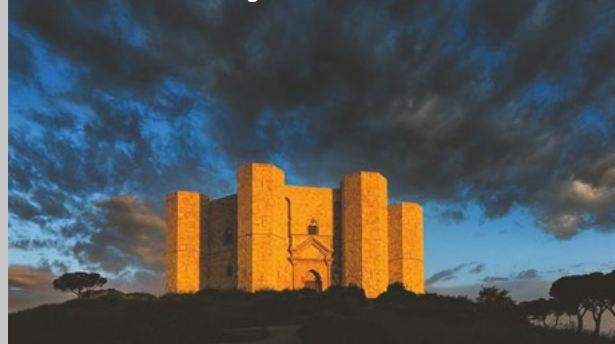
Castel Del Monte, Puglia

Impostò una raccolta ben organizzata di leggi, cercando di separare lo stato dalla chiesa, che lo ostracizzò fino alla scomunica. Uomo straordinariamente colto ed energico, stabilì in Sicilia e nell'Italia meridionale una corte che ospitava i più grandi letterati, poeti, scienziati, astronomi provenienti da tutte le civiltà limitrofe. Fu anche lui un apprezzabile letterato.