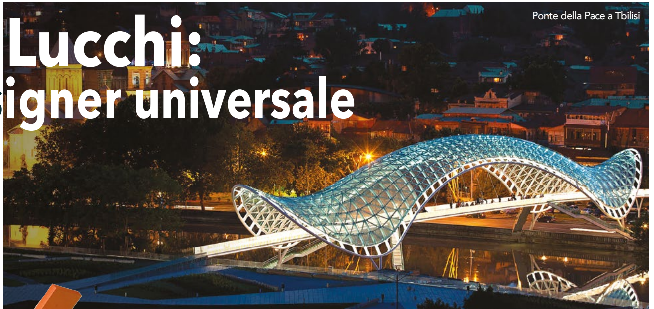
Ponte della Pace a Tbilisi