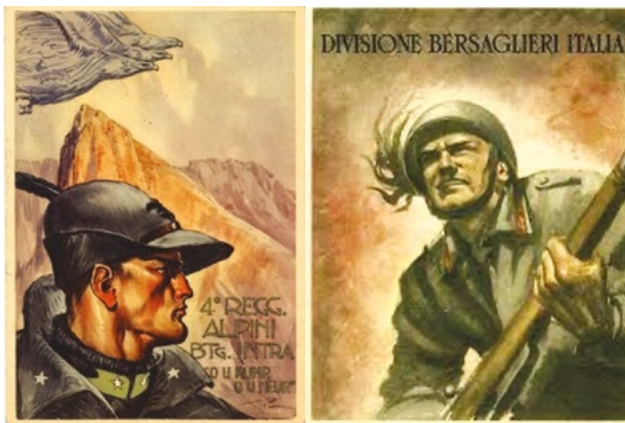
Nella prima immagine: a distanza di un secolo, la figura dell'Alpino ancora è rappresentata vigile della nostra frontiera alpina. Nella seconda immagine: tutta la generosa veemenza e impetuosità del Bersagliere!

d'Italia, specialmente a partire dall'Ottocento, i risvolti bellici dei vari Moti rivoluzionari, e più tardi nel confronto diretto col nemico nell'ambito del Risorgimento italiano, abbiano favorito i primi reclutamenti di truppe specializzate, a seconda delle zone strategiche di operazioni militari. Di conseguenza, nell'Arco alpino, specialmente nella zona orientale confinante con l'Impero austro-ungarico, maggiore ostacolo all'unificazione della Penisola, erano necessari elementi di truppa, familiari e assuefatti all'ambiente alpino, da poter contrapporre ai famigerati Alpenjäger austro-ungarici; mentre nelle valli, nei valichi e nelle pianure si rendeva necessaria una truppa d'assalto celere. Per arrivare a