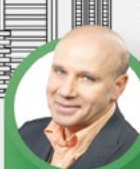
SILVIO ORVIETO LUNEDÌ A VENERDÌ 06:00 - 10:00