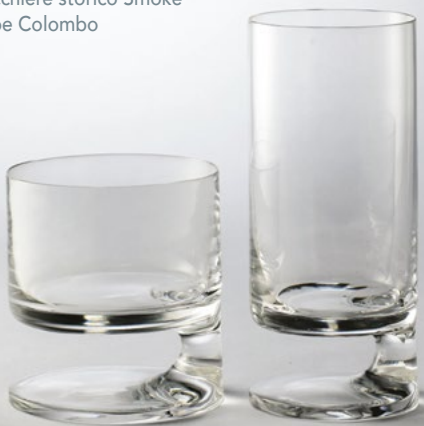
Il bicchiere storico Smoke di Joe Colombo