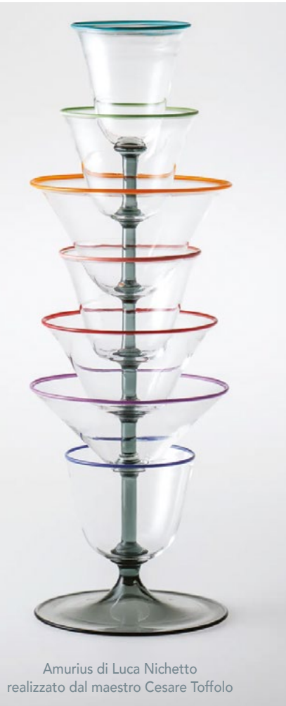
Amurius di Luca Nichetto realizzato dal maestro Cesare Toffolo

"Forme del bere" nasce a Murano ma guarda lontano per abbracciare altri luoghi e altre tecniche uniti in omaggio al tema del bicchiere di vetro, inteso e mostrato come oggetto di uso e come manufatto.