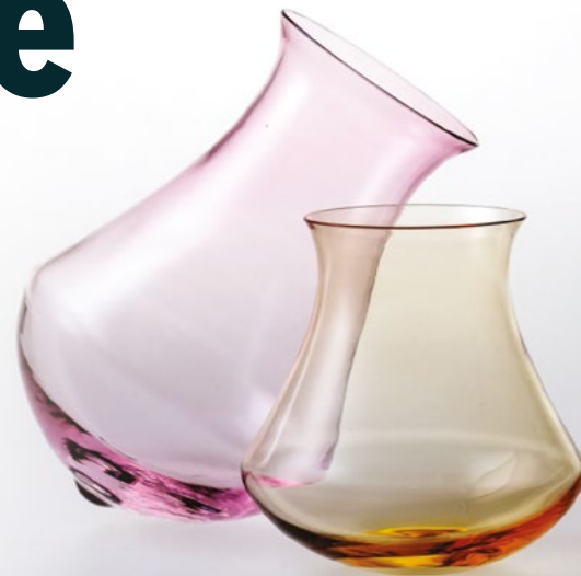
Tulipe, di Astrid Luglio, realizzato dal maestro vetraio Simone Cenedese

muranesi, europei – la mostra testimonia, attraverso una cinquantina di "forme del bere", alcune tra le possibili e valide modalità di affrontare e declinare un piccolo oggetto della quotidianità. Lorenzo Damiani, Giu-