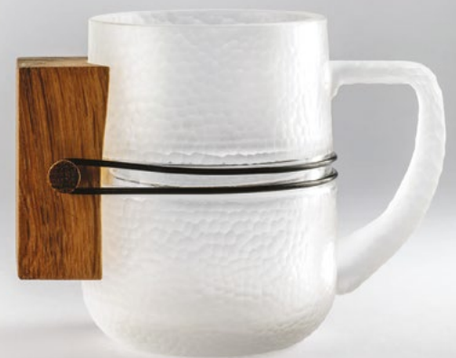
Il boccale da birra Allatua di Lorenzo Damiani