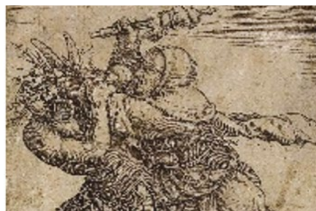
Nella prima immagine: corteo delle Pantaseme; nella seconda la celebre Anguana nelle sembianze di un'affascinante fanciulla, signora della natura silvestre; nella terza un Benandante alle prese con un Malandante.

la mammoccia o Pantàsema veniva bruciata. Si trattava di un grande pupazzo di cartapesta dalle sembianze femminili, che prima veniva fatto danzare, poi dato alle fiamme come rito propiziatorio per la fine dell'estate che si annunciava. In corrispondenza alla Pantàsema del centro-sud Italia, troviamo al nord, nelle Tre Venezie, la figura dell' Anguana , o Angana in Friuli. Si tratta di una variante della stessa antica figura, simbolo della fertilità, anch'essa lega-