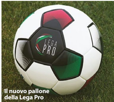
Il nuovo pallone della Lega Pro