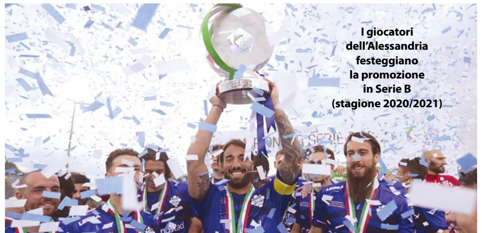
I giocatori dell'Alessandria festeggiano la promozione in Serie B (stagione 2020/2021)

Axe Consulting, con sede a Borston: "Siamo estremamente soddisfatti per la nutrita Comunità degli italiani all'estero, che avrà modo di alimentare la propria passione e che oltretutto in prospettiva potrebbe rappresentare una risorsa importante nell'ottica della sostenibilità delle serie 'minori'. Minori tra tante virgolette perché quest'anno ai nastri di partenza della Serie C troviamo squadre del calibro di Avellino, Bari, Catania, Cesena, Foggia, Messina, Modena, Padova, Palermo, Pescara, Piacenza, Reggiana e Triestina, oltre alla Juve Under 23. Mi sembra inoltre da evidenziare l'accordo con una leggenda del nostro calcio per il ruolo di testimonial: sarà Beppe Signori l'uomo immagine della 196 Sports".