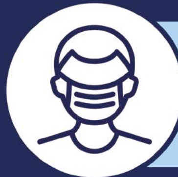
Copritevi il viso

Obbligatorio per tutti i minori di 10 anni su tutti i tipi di trasporto pubblico e in luoghi pubblici, chiusi o parzialmente chiusi.