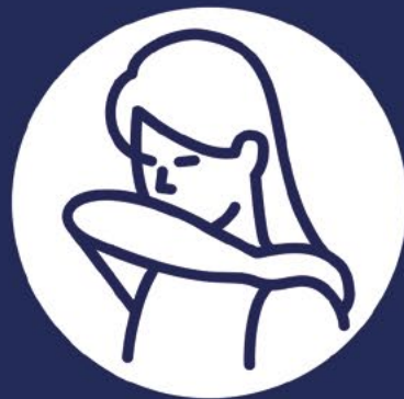
Tossisci nel cavo del gomito