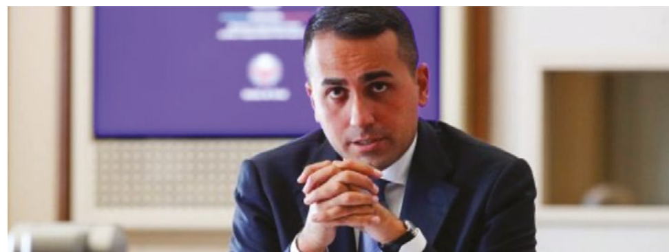
ROMA - Il Ministro degli Affari Esteri e della Coopera-

zione Internazionale, Luigi Di Maio , ha avuto il 28 gennaio un colloquio telefonico con il nuovo Segretario di Stato degli Stati Uniti, Antony Blinken . Lo ha reso noto la Farnesina. Nel corso della conversazione, i due Ministri hanno fatto stato delle eccellenti relazioni bilaterali, soffermandosi sui principali dossier di comune interesse, tra cui la Libia, la cooperazione in ambito NATO, il contrasto al terrorismo, il caso Navalny e i rapporti con