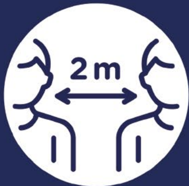
Mantieni le distanze