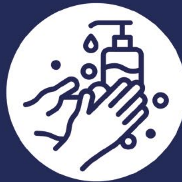
Lavati le mani