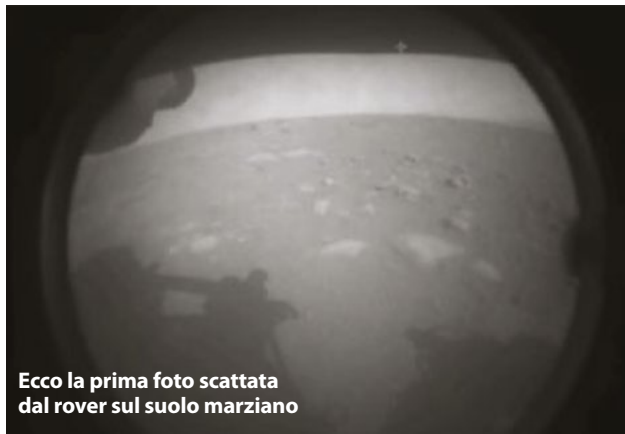
Ecco la prima foto scattata dal rover sul suolo marziano

LA MISSIONE. Per due anni il rover setaccerà il suolo per raccogliere i primi campioni destinati a essere portati sulla Terra. La missione Mars 2020 segna infatti l'avvio del programma Mars Sample Return (Msr), di Nasa e Agenzia Spaziale Europea (Esa), al quale l'Italia contribuisce con la sua agenzia spaziale, l'Asi, e con l'industria,