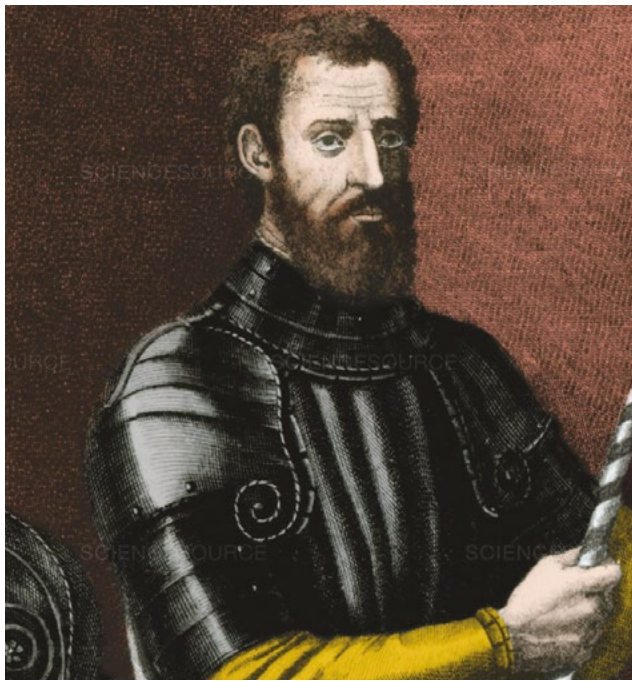
Giovanni da Verrazzano, figura di un grande navigatore italiano e nome spesso relegato tra le pieghe della storia. "Premier grand pilote de France", con tale titolo ufficiale, patrocinato dai mercanti fiorentini della colonia di Lione, navigò nel 1524 verso il Nuovo Mondo per conto del re di Francia Francesco I. Esploratore e cartografo della costa atlantica americana, è, fuori dubbio, il Padrino della Nuova Francia.

Giovanni Da Verrazzano (per i francesi: Verrasan, Verrazan, Verrazzane, ecc...) vide la luce nel 1485 a Val di Greve, poco distante da Firenze. Malgrado le pretese di una sua nascita a Lione, in Francia, Verrazzano si considerava, ed è stato considerato dai suoi amici, fiorentino di nascita. La Francia che accolse Verrazzano, accolse l'umanista, l'uomo tipico del Rinascimento Italiano. Nel 1523, Francesco I, re di Francia, raffinato ammiratore del Rinascimento (Leonardo da Vinci morì in Francia fra le sue braccia), parlava benissimo