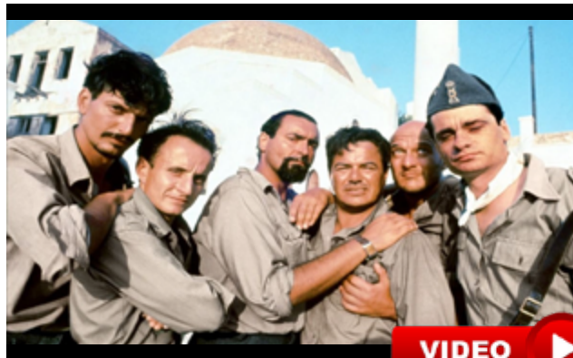
Mediterraneo - 1992

L'Istituto Luce Cinecittà aderisce alla campagna nazionale #IoRestaCasa, promossa dal Ministero per i beni e le attività culturali e per il turismo (Mibact), per portare nei giorni dell'emergenza, dentro le case di tutti gli italiani, una grande offerta di contenuti digitali. Migliaia di ore di intrattenimento e conoscenza a disposizione di tutti, gratuitamente, su tutti i siti web di Luce-Cinecittà, a comin-