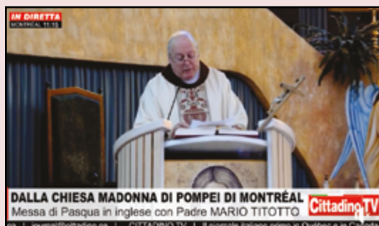
Madonna di Pompei

https://www.facebook.com/missionmarieauxiliatrice/