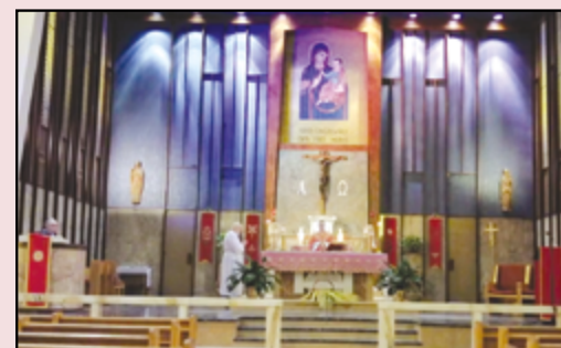
Madonna della Consolata

https://www.facebook.com/St.JohnBoscoMTL/