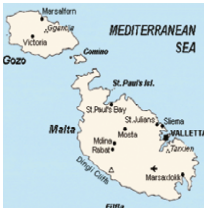
Nella prima immagine, la Sicilia ed il suo arcipelago con Malta a sud, completata dal suo stesso arcipelago, con l'isola di Gozo (Gozzo in italiano) a nord, ovvero l'isola di Calipso di omerica memoria, e l'isola di Comino, tra Gozo e Malta. Da notare la nomenclatura inglese (con l'immane e britannica "Victoria") tutt'oggi in vigore.

Oggi, per la stragrande maggioranza, considerare Malta terra irredenta risulta un'evidente pretesa nazionalista italiana. Purtroppo la storia, come sempre, la scrivono i vincitori. Le verità e le realtà più lampanti vengono travisate a favore di artificiose interpretazioni della storia. Oggi Malta è presentata staccata ed estranea all'evoluzione storica e geopolitica siciliana e italiana. Che lo si voglia o no, Malta è geograficamente parte integrante dell'arcipelago siciliano, assieme ad una serie di piccoli arcipelaghi e isole (gli arcipelaghi Egadi, Eolie e Pelagici, più Ustica e Pantelleria). Sin dall'antichità, la storia dell'isola di Malta ha più o meno rispecchiato quello dell'insieme delle isole. I componenti dell'arcipelago hanno scambiato cultura e popolazione sin dai tempi preistorici. Malta fu colonizzata nel 5000 a.c. da popolazioni provenienti dalla Sicilia. Ancora oggi, la lingua maltese è una variante del dialetto siciliano. Inoltre, Malta fece parte del regno siciliano dal 1.127 al 1.798, sebbene infeudata all'Ordine di San Giovanni dal 1530 in poi. Anche recentemente, Malta è stata presentata come una legittima propaggine dell'impero britannico in pieno Mediterraneo. Una leggittimità