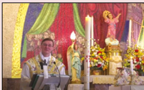
San Giovanni Bosco

https://www.facebook.com/MadonnadellaDifesaMTL/