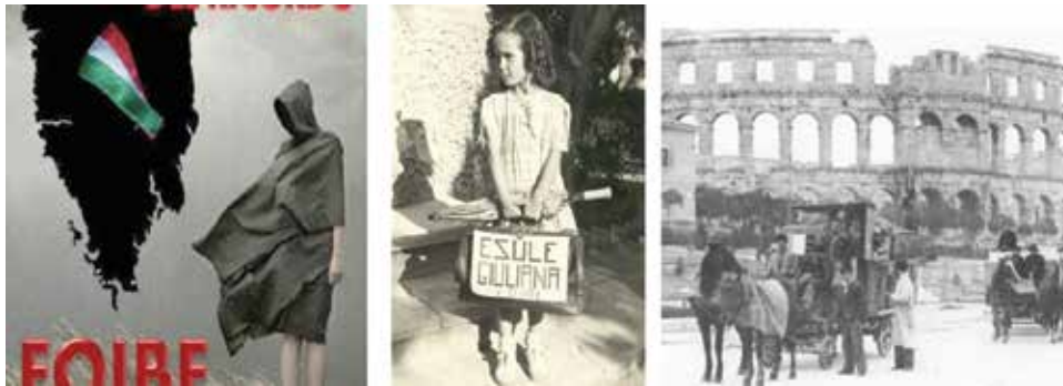
Nella prima immagine, l'Istria abbrunata dal ricordo delle foibe. Nella seconda, tra i 350.000 profughi, una piccola esule giuliana orfana delle foibe, che fugge l'inferno titino, lasciando dietro la sua famiglia trucidata. Nella terza: l'esodo! Addio, Pola! L'interminabile colonna di profughi dalmato-giuliani che fugge il terrore titino, mentre l'Arena di Pola, testimone d'italico retaggio, sta a guardare!