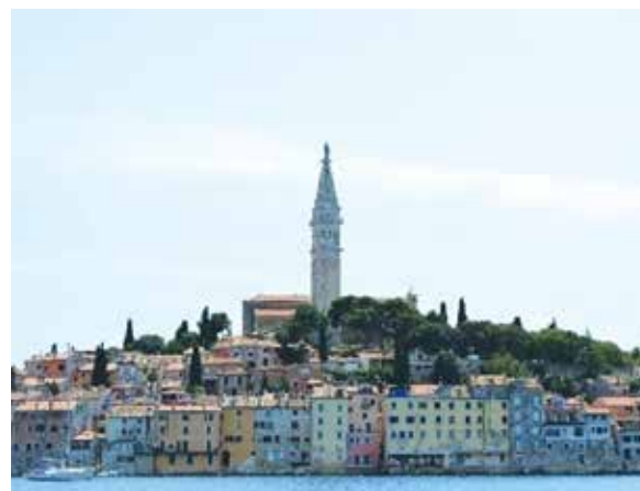
Rovigno (oggi Rovinj in Croazia) splendida città dell'Istria, definita: la Venezia sul mare. Al centro svetta imponente il tipico campanile veneto. Nella seconda immagine a destra: Torre dell'orologio della stessa cittadina; motivo tanto comune delle città venete, ove ancora troneggia, sentinella, il Leone di S. Marco.