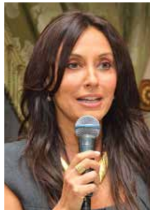
Sen. Francesca Alderisi