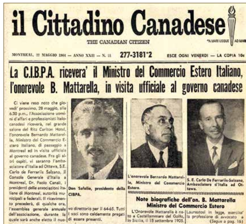
Una copertina storica del Cittadino Canadese: 22 maggio 1964