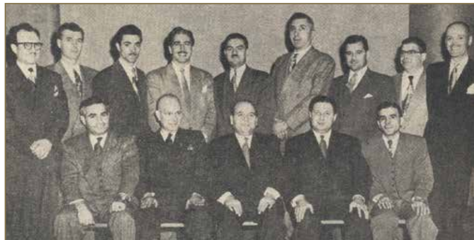
Il consiglio di amministrazione del biennio 1951 - 1952