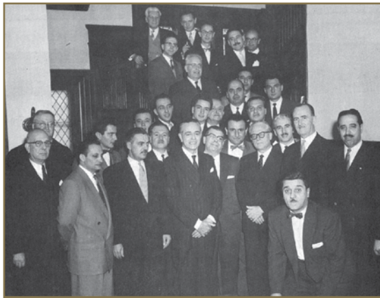
Il Presidente della Repubblica italiana Giovanni Gronchi, in visita a Ottawa, 1956