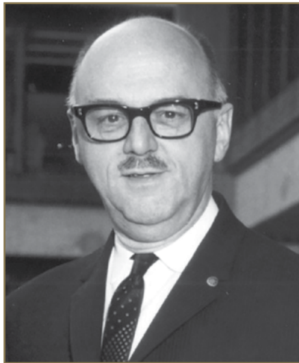
Jean Drapeau - 1967