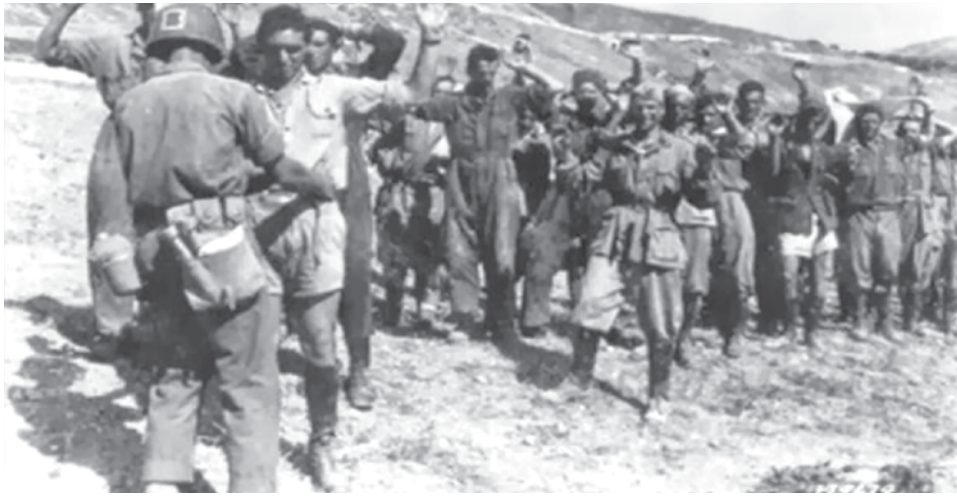
Il massacro di Biscari. A seguito della resa, 78 militari italiani della 'Livorno' e due tedeschi vennero barbaramente trucidati, in barba al codice militare; si preannunciava l'obbrobrio delle "marocchinate", Tombolo, cc., in nome della ...liberazione!!!

di palazzo, di italico costume, che portarono al 25 luglio del '43 ed al codardo arresto di Mussolini, tutto è sintetizzato dalla vera storia dello sbarco degli alleati in Sicilia a Gela, nel 1943. Nel 1952, misteriosamente spari la famosa lapide di Cassibile, posta sul luogo ove avvenne (sembra ufficialmente...vedremo in seguito) la firma della "resa incondizionata" dell'Italia. Recentemente, sulla spiaggia di Trappeto (Trapani), son stati distrutti i resti di un bunker costiero dell'Esercito italiano a difesa dell'isola, che la popolazione chiamava "la Cupola": un ennesimo sfregio che distrugge pezzi della nostra storia, ne cancella i ricordi, le immagini e i momenti. Vi è che questi episodi rivelano un'altra drastica rimozione: quella della vera storia dello sbarco angloamericano in Sicilia, tramandato come una "passeggiata" festosa avvenuta con distribuzione di cioccolata e chewing gum. Una vera offesa all'orgoglio siciliano! Le cose andarono ben