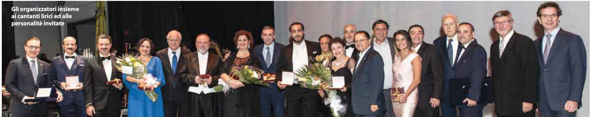
Gli organizzatori insieme ai cantanti lirici ed alle personalità invitate