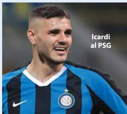
Icardi al PSG