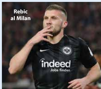
Rebic al Milan