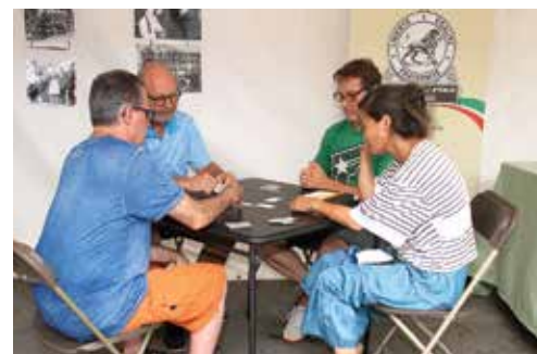
Un momento del torneo di scopa

Grazie a tutti i nostri sponsors che hanno contribuito al successo di questa edizione della Settimana Italiana di Montreal!