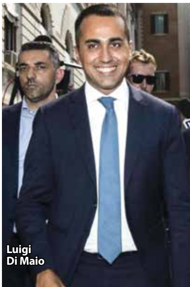
Luigi Di Maio

condo giro di consultazioni al Quirinale. È partito martedì, 27 agosto, alle 16, il secondo giro di consultazioni del Presidente della Repubblica. Dopo la telefonata con il presidente emerito Giorgio Napolitano, Sergio Mattarella ha ricevuto al Colle alle 16 la presidente del Senato, Elisabetta Casellati. Alle 17, invece, ha avuto un colloquio con Roberto Fico. La prima giornata di consultazioni si è conclusa con l'incontro tra il presidente della Repubblica e il gruppo misto del Senato e della Camera. Il 28 agosto i primi ad essere ascoltati saranno i parlamentari di Liberi e Uguali, alle 10.30. Alle 11 è in programma il colloquio con i gruppi di Fratelli d'Italia. Nel pomeriggio i colloqui riprenderanno alle 16 con i gruppi del Pd. Seguiranno, alle 17, i rappresentanti di Forza Italia. La Lega, invece, salirà al Colle alle 18. A chiudere il secondo giro di consultazioni sarà il Movimento 5 stelle alle 19.