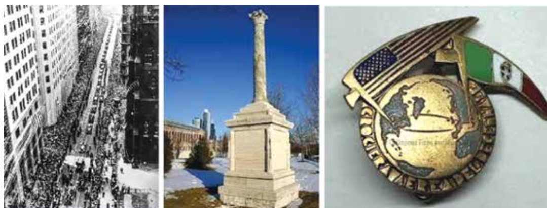
A sinistra, uno scorcio panoramico del trionfo di Balbo sulla celeberrima 5th av. Al centro come appariva qualche decennio fa l'imbarazzante e celebre colonna, prima di cascare nell'abbandono e nell'incuria. A destra: una curiosa ed interessante medaglia-ricordo coniata per celebrare l'evento storico. Notate le aste delle due bandiere: due fasci littori!

la personalità del trasvolatore. Balbo non lo notò. Nel 1950 Eisenhower, nel corso di un viaggio in Italia, ebbe a dire: "Balbo era fatto più per gli americani che per gli italiani". Questo il giudizio su Balbo da parte di un acerrimo antifascista. Invece i nostri nostalgici resistenziali continuano a farneticare sul "truce fascismo" e i suoi personaggi; un movimento politico che mai più tornerà come tale. (Continua)