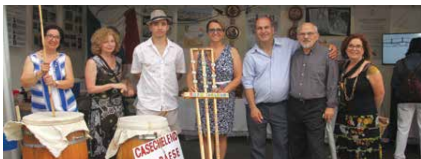
L'Associazione Casacalendese con il Bufù, lo strumento musicale tipico