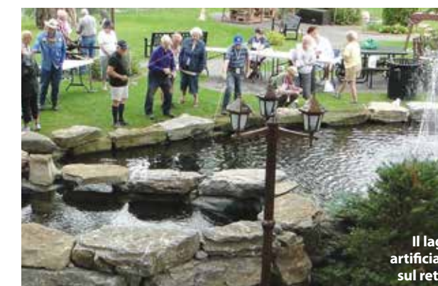
Il lago artificiale sul retro

divertimenti: fontane zampillanti, salottini eleganti disseminati in tutto il complesso, un mini-golf intitolato a Yves Ryan, sindaco di Montréal-Nord per 45 anni (che ha vissuto la terza età nella Residenza), una piscina con sauna, una sala di informatica, una sala da biliardo, un campo di bocce, la palestra “Coeur en action” col personal trainer (monitoraggio personalizzato mensile) convenzionata col “Centre ÉPIC”