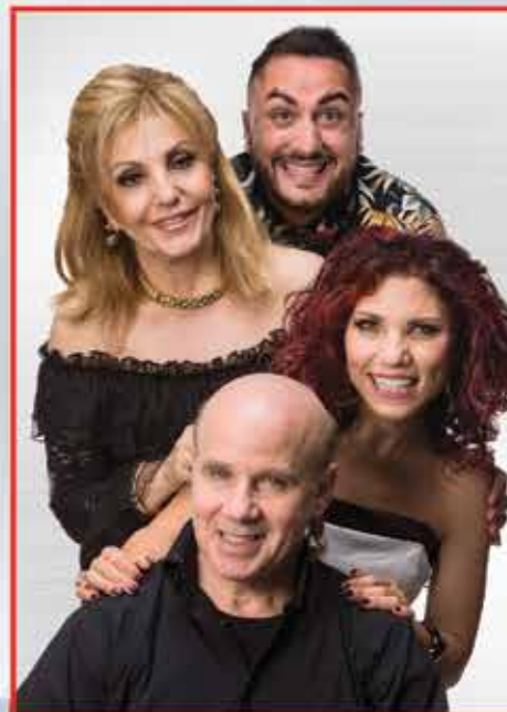
SILVIO ORVIETO LUNEDÌ AL VENERDÌ 06:00 - 10:00