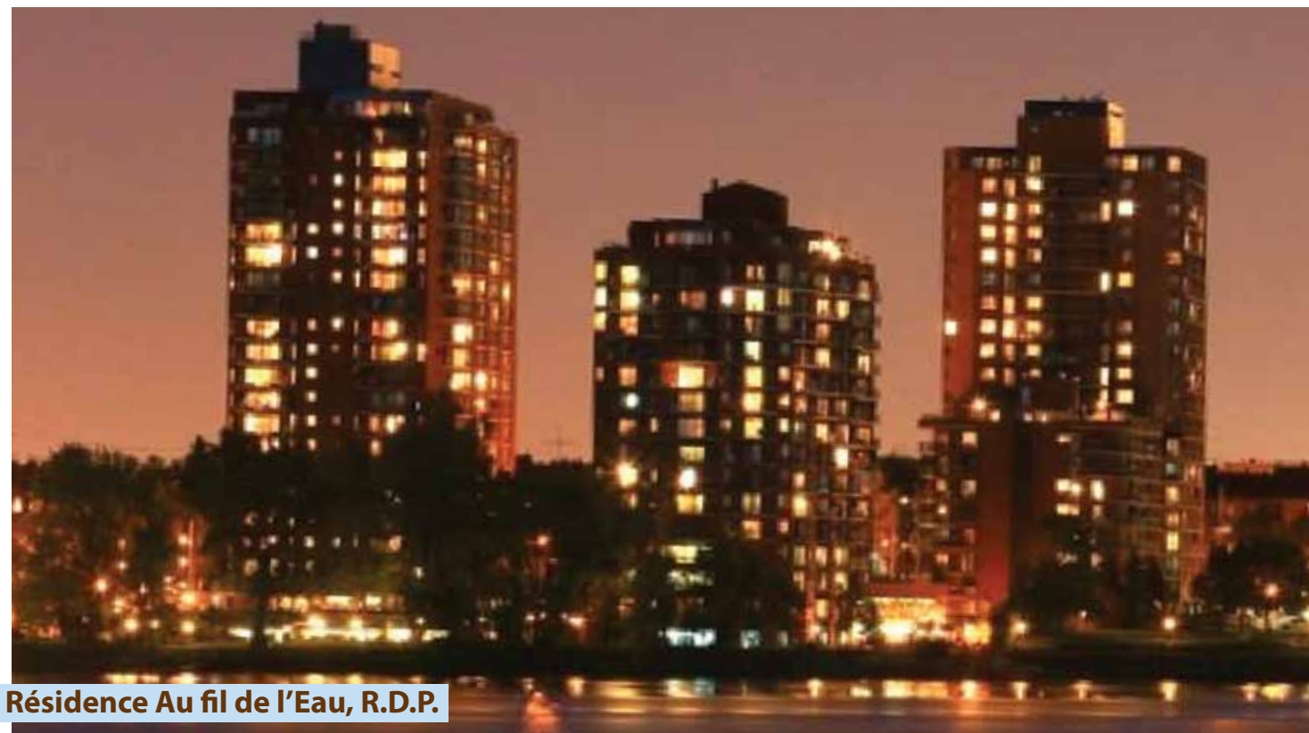
Résidence Au fil de l’Eau, R.D.P.

mosaico della Madonna proveniente da Joppolo, paese di origine dei Migliara), un depanneur, una parrucchiera, uno sportello bancario, ripostigli dedicati, lavanderia, servizio di concierge e di pulizia, servizio di trasporto, oltre a 3 auto in comodato d’uso a disposizione (“La Roue”), videocamere di sorveglianza, addetti alla sicurezza ed il rinomato ristorante “La Riviera” con piatti degustabili in sala o comodamente in appartamento grazie al servizio catering, senza contare il brunch domenicale. Agli utili servizi, poi, si aggiungono formidabili