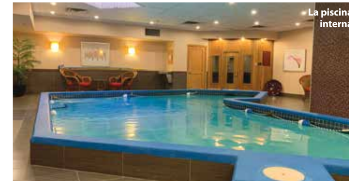
La piscina interna