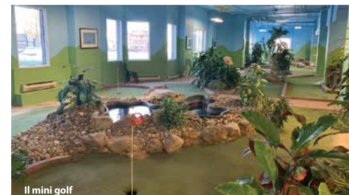
Il mini golf