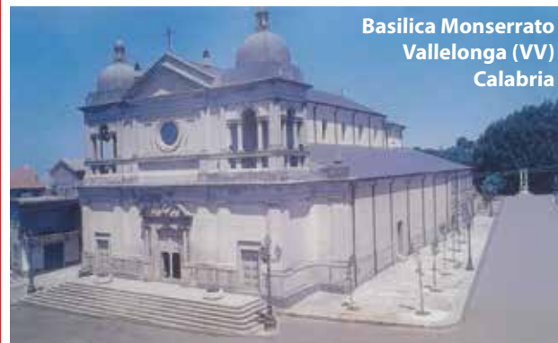
Basilica Monserrato Vallelonga (VV) Calabria