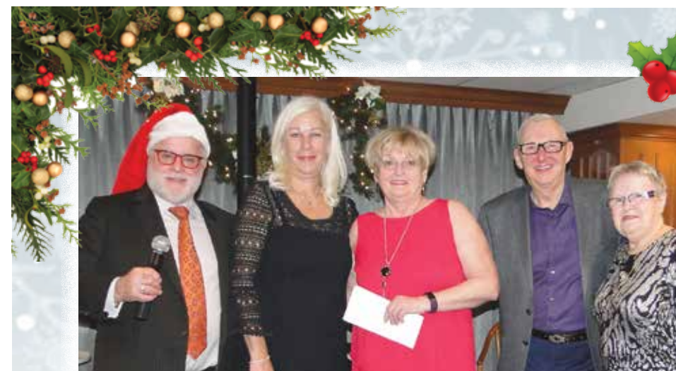
Martedì 11 e mercoledì 12 dicembre si è tenuta una doppia festa di Natale per la gioia di quasi 1.000 “inquilini”

damigiane di vino offerte da Migliara per gli eventi speciali, un lago artificiale con la pesca delle trote da aprile a settembre ed una ventina di appezzamenti di terreno per coltivare l’orto d’estate. Chapeau! Non manca davvero nulla per vivere una terza età “a 5 stelle”: tutto a portata di mano. Una manna dal cielo per chi vive in un paese dagli inverni lunghi e rigidi. La pensano così anche i residenti.