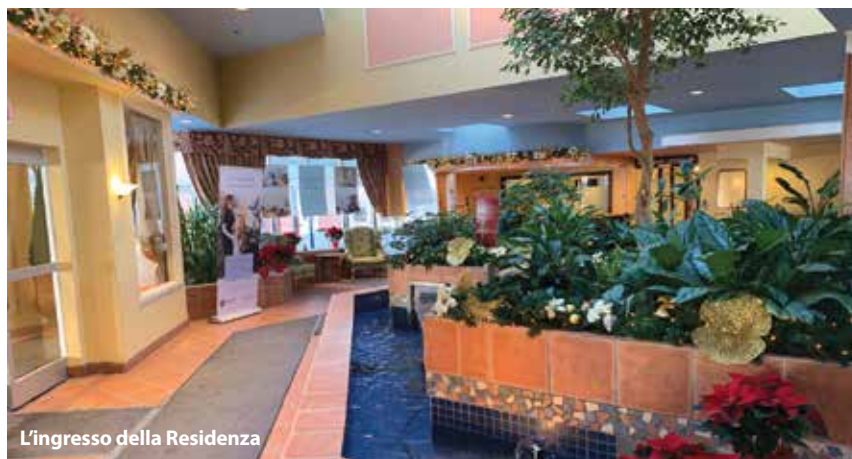
L'ingresso della Residenza