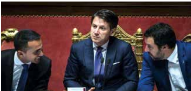
Mediatori in campo: da Mattarella a Giorgetti

ROMA, (quotidiano.net) - Borsa in rosso e spread oltre quota 300. Gli effetti del Def (Documento di economia e finanza) e dello scontro Italia-Europa all'apertura dei mercati si fanno sentire. Pesantemente. Da qui, la necessità, al di là degli attacchi 'senza se e senza ma' di Luigi