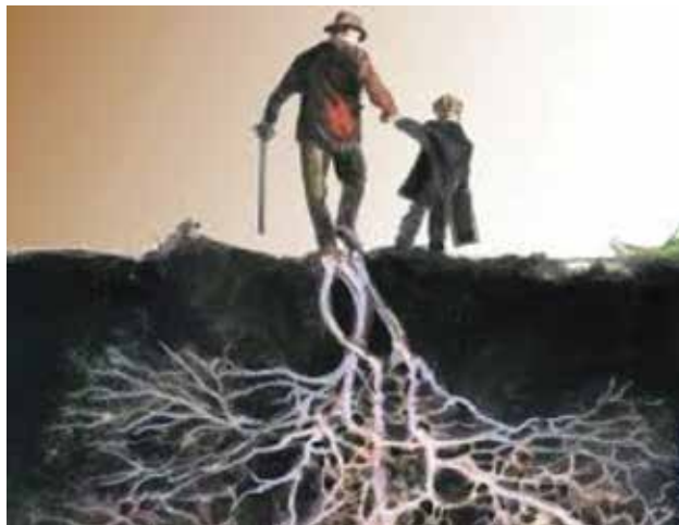
Ho cambiato il cielo ma non l'anima! L'albero divelto, non dimentica le radici lasciate nel sacro suol natio!

percepito solo dai protagonisti dell'ora. L'Edificio, anche se testimonia un capitolo difficile vissuto dalla nostra comunità, oggi giorno assomma simbolicamente anche il carattere, la peculiarità e l'indole della nostra gente. Oltre al retaggio storico-umano, esso è testimonianza della nostra presenza e integrazione; ricorda, altresì, come un libro aperto inciso nella pietra, i nostri valori, l'antico nostro retaggio, testimone di civiltà. Tutto questo vuol dire che siamo nel giusto; questo ci incita a perseverare e prova che il nostro compito risponde ad un arcano richiamo che viene da lontano, che promana da una coscienza comunitaria tutta nostra; e che ci ricorda: quando si avevano poche possibilità, ma c'era tantissima volontà. Oggi noi, a