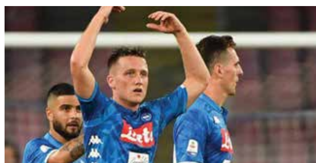
Delude l'Inter: i nerazzurri non vanno oltre il 2-2 in

e sale in testa alla classifica insieme a Juventus e Napoli.