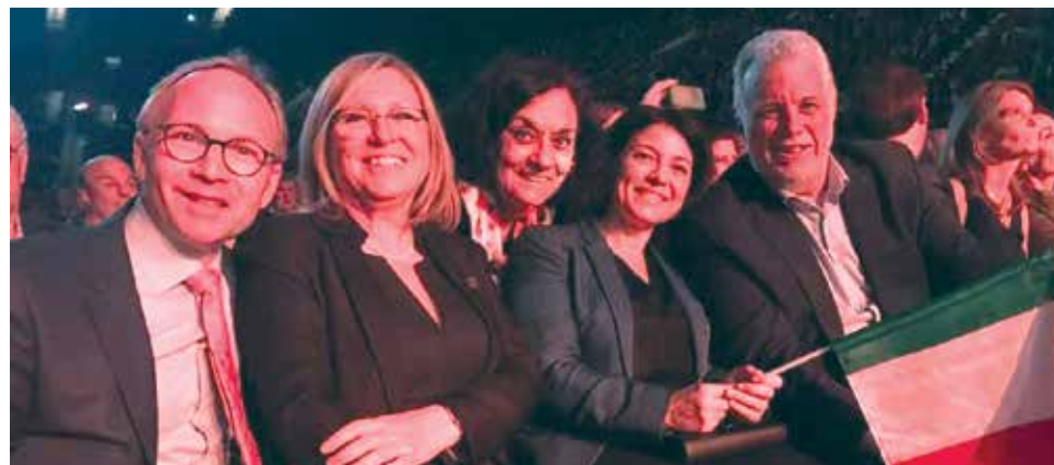
Da sinistra: Martin Coiteux, Francine Charbonneau, Rita de Santis, Filomena Rotiroti e Philippe Couillard