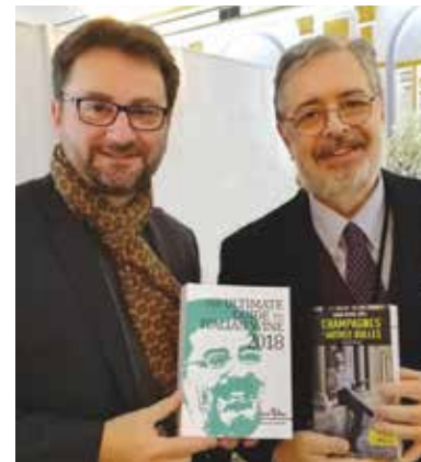
Daniele Cernilli con Guénaél Revel, giornalista del magazine 'Vins &amp; Vignobles'

dei degustatori di Doctor Wine. Nel suo passato, è stato cofondatore del Gambero Rosso nel 1986, curatore della Guida dei Vini d'Italia per 24 edizioni, direttore del magazine Gambero Rosso, personaggio televisivo alla guida del Gambero Rosso Channel, docente ai corsi professionali alla Città del Gusto di Roma nonché ai corsi di degustazione e analisi sensoriale dell'Associazione Italiana Sommelier. Ha vinto diversi premi per il suo contributo alla diffusione della cultura enogastronomica tra cui la targa d'Oro dell'Associazione Enotecnici nel 1999 ed è stato incluso nella classifica di Decanter tra le 50 persone più influenti nel mondo del vino (2007-2008-2009).