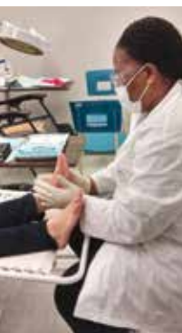
A due passi da St-Léonard