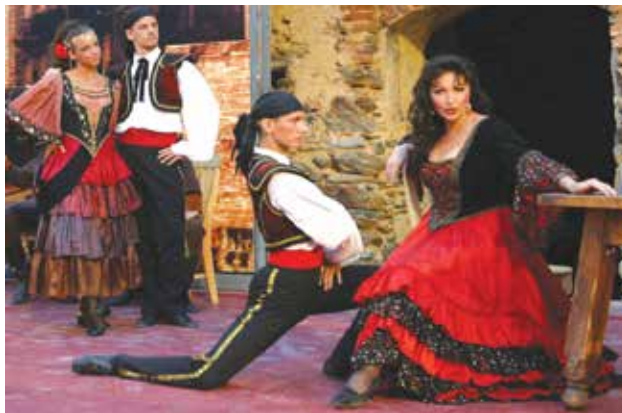
Immagine tratta dallo spartito "HABANERA" della Carmen di Bizet (L'amour est un oiseau rebelle). La Habanera forse dal nome della capitale cubana, Havana?, anteriore al tango, è originario della costa mediterranea spagnola, soprattutto Barcellona e Alicante; ha contribuito all'eleganza ed tocco goliardico del tango moderno. Ne ha fatta di strada quel che fu il primo ed umile tango dei "desperados" dei bassifondi delle città di Rio de la Plata..

l'America, dove è nato e si è sviluppato; l'Africa che a livello ritmico ha contribuito alla sua nascita; ed infine l'Europa, che con i suoi migranti, specialmente italiani, contribuì non poco al suo sviluppo. Il Tango è stato definito: storia di un abbraccio, per spiegare l'incontro di razze; ballato è un linguaggio muto che si esprime con il corpo: è passione, nostalgia, tristezza e anche sofferenza. All'origine vi è il lamento e le tristenie degli schiavi neri. Fin'anche la parola "tango" sembra riferirsi alla schiavitù ed al traffico dei neri. Non è facile stabilire l'origine della parola tango. Alcuni vorrebbero farne risalire l'origine alla parola