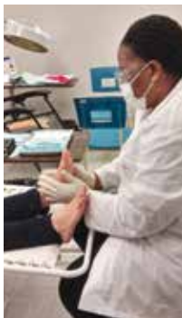
A due passi da St-Léonard