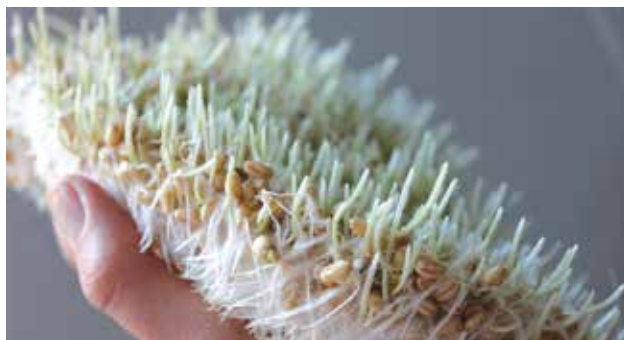
Una zolla di germogli di grano per l'allestimento del tradizionale "S. Sepulchro Pasquale". È evidente tra la radice e lo stelo, il chicco di grano ormai "morto": centralità da cui emerge la vita (radici-stelo) che si rinnova ogni anno all'equinozio di primavera. E il ciclo continua!

porale. Iniziamo proprio dalla Croce. Per molti la Croce è esclusivamente simbolo del Sacrificio di Cristo e Via della redenzione. Nella storia ne esistono molte varianti, le cui origini sono molto più antiche, legate alla filosofia pagana e alla Legge universale. Se visto nell'insieme quale simbolo mistico universale, la Croce Cristiana assume doppio valore e rispetto, poiché oltre ad essere sacro simbolo della fede cristiana del Sacrificio, è ugualmente sacro come segno mistico della legge eterna che dice: "Quando due opposti si