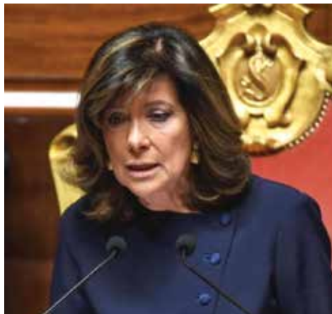
Maria Elisabetta Alberti Casellati

nata a Rovigo, 12 agosto 1946 ed è laureata in giurisprudenza e in diritto canonico alla Pontificia Università Lateranense, iscritta all'Ordine avvocati di Padova. Aderisce a Forza Italia fin dalla sua fondazione; dal 2001 al 2002 è vice capogruppo di Forza Italia al Senato della Repubblica e dal 2002 al 2005 vice capogruppo vicario. Tra il 2006 e il 2008 è nuovamente vice presidente del gruppo al Senato; eletta per la prima volta senatrice nel 1994, per la XII Legislatura. Tranne che nel 1996, è sempre rieletta nel 2001, 2006, 2008, 2013 e 2018. Ha avuto inoltre incarichi di governo in tre Governi Berlusconi. Il 15 settembre 2014 viene eletta dal Parlamento in seduta comune con 489 voti membro del Consiglio Superiore della Magistratura in quota Forza Italia con una maggioranza pari a 3/5 dei votanti (486 voti).