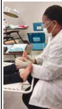
A due passi da St-Léonard